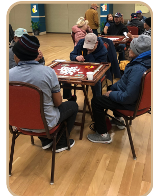
¡Que empiece el juego! Torneo de dominó