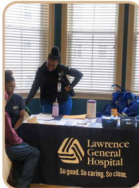
Día de Alerta de Diabetes con LGH