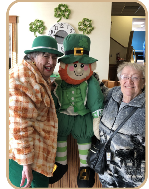
Celebramos el día de San Patricio