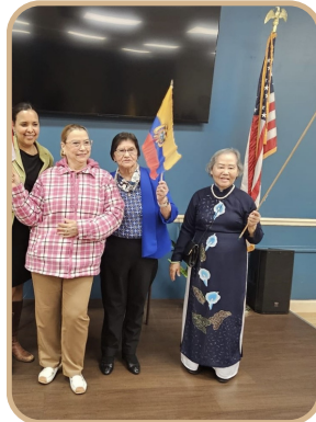
Celebramos el Día Internacional de la Mujer