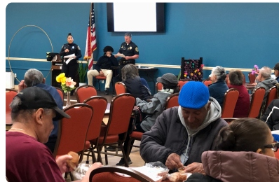
Taller sobre fraude y estafas con LPD