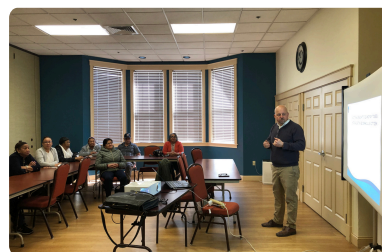
Clínica de educación fiscal con NLA

¡Ven a conectarte, divertirte y socializar con otros