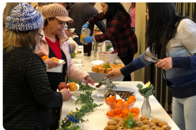
Desayuno con el alcalde Brian De Peña